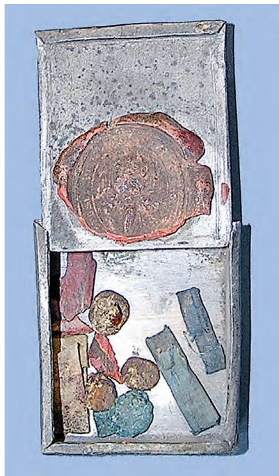
Ryc. 1. Relikwiarz z pieczęcią biskupią i zawartością, z ołtarza głównego kościoła św. Klary we Wrocławiu

nu z zasuwany wieczkiem. Wymiary: dług. 65, szer. 55, wys. 29 mm. Wewnątrz znajdowały się: relikwie 3 Świętych zawinięte w prostokątne zwitki jedwabiu (2 barwy zielonkawej, 1 kremowej), 3 grudki substancji organicznej, rodzaj brązowego klipsa (ryc. 1) oraz wspomniany certyfikat.