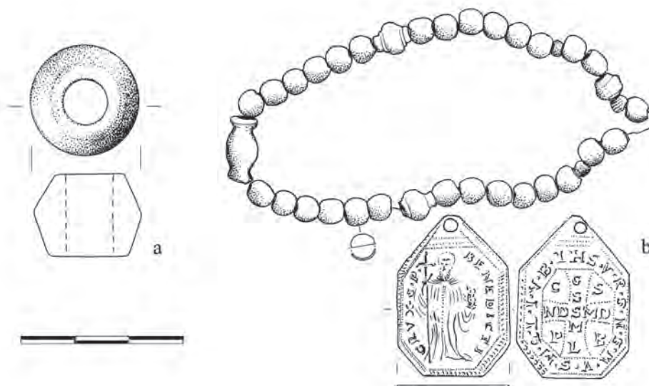
Ryc. 4. Wrocław, ul. Szewska. Przedmioty znalezione luźno na terenie cmentarza przy kościele św. Macieja a – przęślik z łupku wołyńskiego; b – różaniec z medalikiem św. Benedykta.

W odległości około 0,5 m na północ od kości podudzia szkieletu 162 znaleziono różaniec z medalikiem św. Benedykta. Związek tego znaleziska z grobem 162 jest wysoce wątpliwy. Medalik wycięty z blachy mosiężnej, w kształcie siedmiokąta, z otworem u góry. Wys. 31, szer. 21, grub. 0,7 mm. Przywieszony był prawdopodobnie do różańca, z którego zachowały się 33 zielone paciorki z nie-