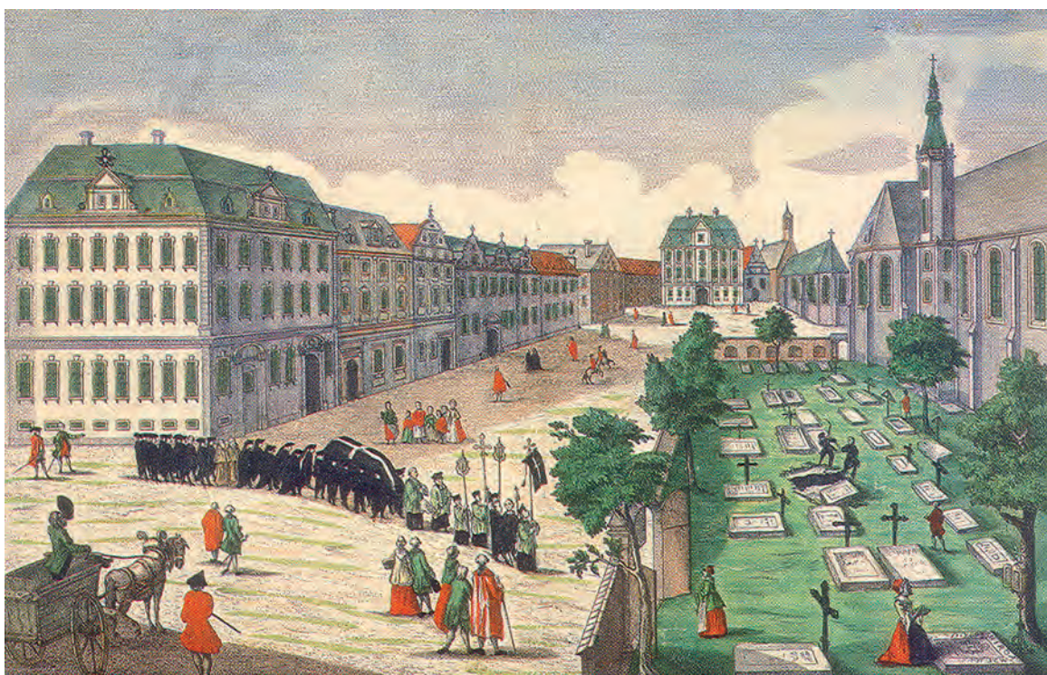
Ryc. 1. Wrocław. Kondukt żałobny kroczący od strony placu Nankera w stronę cmentarza przy kościele św. Macieja. Imaginowana akwaforta F. B. Wernera z 1760 r. Za R. Len 1997, 78

grobu Angelusa Silesiusa (Jana Schefflera), naruszając zapewne wcześniejsze pochówki. Ten poeta, mistyk i teolog w 1653 r. złożył katolickie wyznanie wiary i na bierzmowaniu przyjął imię Angelus i jako kapłan świecki zamieszkiwał w klasztorze krzyżowców, gdzie zmarł w 1677 r. i został pochowany w kościele św. Macieja (Kaczmarek, Witkowski 1997, s. 6, 9). W najbliższym czasie, po zakończeniu remontu kościoła św. Macieja, planowane są badania wykopaliskowe na placu przy świątyni.